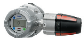
Dräger Polytron 8700 с присоединенной распределительной коробкой e-Box: версия с проводкой повышенной безопасности.

Одинаковая конструкция, одинаковый принцип действия: Серия Polytron 8000