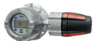
Dräger Polytron 8700 Взрывозащищенная измерительная головка для контроля горючих газов